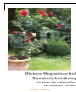
3. Ausgabe Dezember 2017