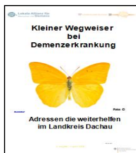
2. Ausgabe August 2016