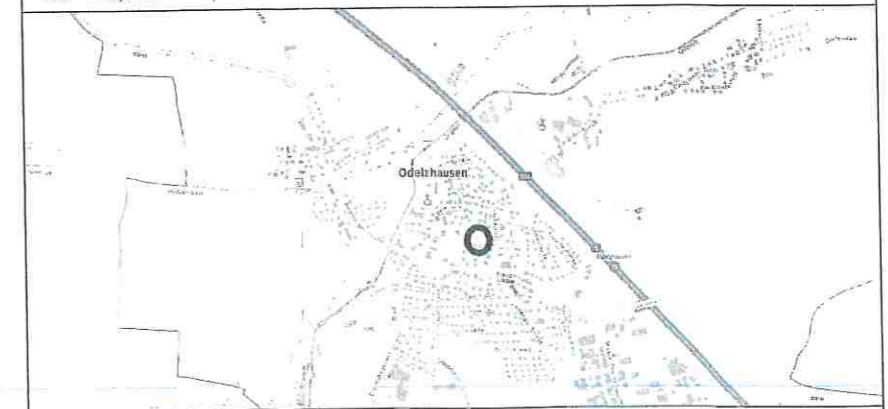
AUSZUG AUS DER TOPOGRAPHISCHEN KARTE, OHNE MASSSTAB ATKIS - © 2021 Bayerische Vermessungsverwaltung